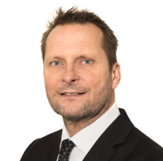
Urban Andersson Transportarbetare- förbundet